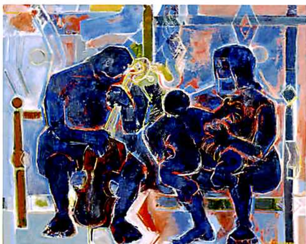
《王と王妃》1975(昭和50年)、北海道立近代美術館蔵