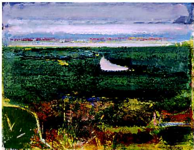
《勇払原野とウナイ湖》1978(昭和53年)、苦小牧市立病院蔵