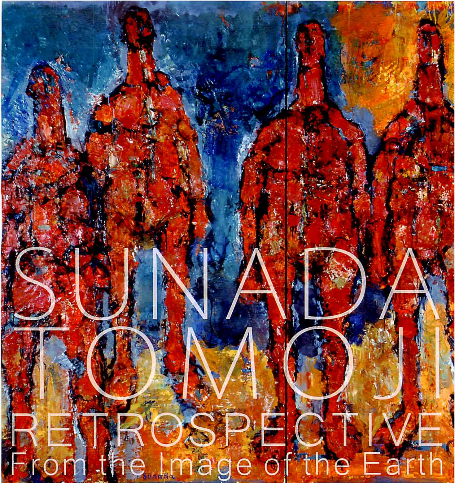
《北海の男たちII》1900年代、当館蔵