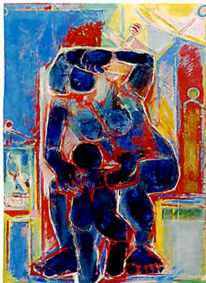
《母子像》1976(昭和51年)、札幌芸術の森美術館蔵