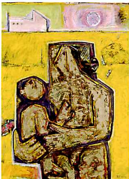
《原野と父子》1982(昭和57年)、個人蔵